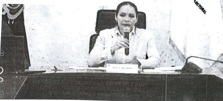
► CNE habló de "un proceso electoral eficiente"

Autoridades explicaron que desde 2008 comenzaron a impulsar la idea de que el país contara con documentos que avalen a personas no identificadas como hombre o mujer.